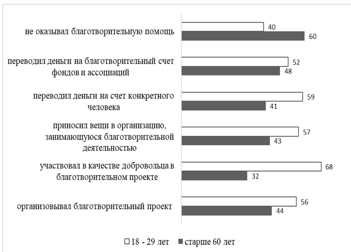
Рис. 3. Распределение ответов на вопрос «Вы каким-либо образом оказывали благотворительную помощь?», %

Анализируя формы благотворительной и добровольческой деятельности, воспроизводимые на территории Волгограда, можно отметить, что среди респондентов старше 60 лет организовывали благотворительный проект 44 % респондентов, а среди молодежи до 29 лет – 56 %. Пожилые граждане старше 60 лет предпочитают такие формы участия: «Переводить деньги на благотворительный счет фондов, ассоциаций» – 48 %, «материальная помощь (вещами и прочим)» – 43 %, «переводить деньги на счет конкретного человека» – 41%. Представители молодого поколения в целом более активно проявляют себя в благотворительной деятельности, 56 % молодежи организовывали благотворительные проекты. Молодежь гораздо чаще предпочитает участвовать в качестве добровольца в благотворительном проекте (68 %), чем граждане третьего возраста (32 %).