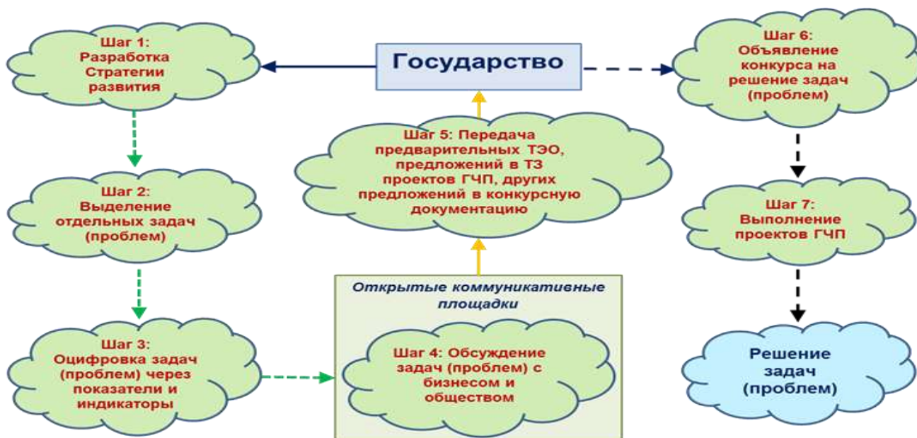
Схема работы по формированию и выполнению проектов ГЧП на базе федеральных и региональных коммуникативных площадок

Таким образом, в результате применения сетевого подхода к организации государственно-частного партнерства была разработана модель коммуникативной площадки, на которой действует механизм поиска точек сборки интересов государства и бизнеса в рамках реализации проектов государственно-частного партнерства. Также нами определены свойства и границы информационного пространства, внутри которого баланс интересов бизнеса и власти будет сохраняться в течение всего срока действия соглашения о государственно-частном партнерстве.